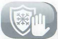
Fonction hors gel