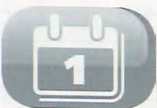
Programmation sur 24h